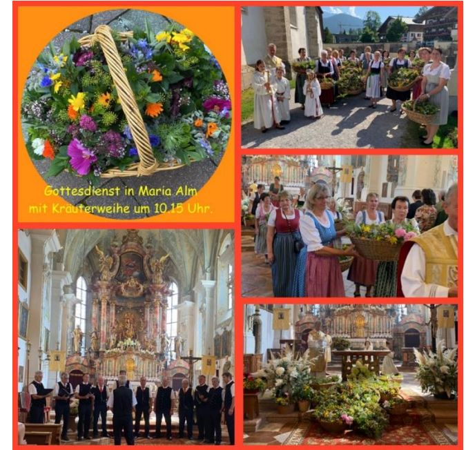
Gottesdienst in Maria Alm mit Kräuterweihe um 10.15 Uhr.