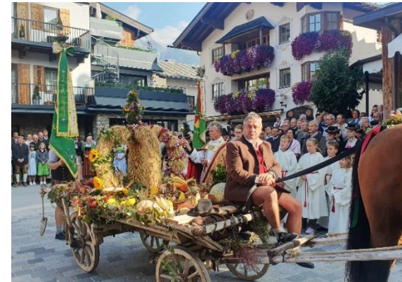
Text und Foto: N. Widauer

Am 1. Oktober hat die Pfarrgemeinde Maria Alm das Erntedankfest ganz besonders gefeiert. Bei strahlend schönem Herbstwetter hat sich der Festzug vom alten Feuerwehrhaus in Richtung Dorfplatz bewegt. Alle Vereine sind in großer Zahl ausgerückt. Die Trachtenmusikkapelle vorneweg. Auf dem Dorfplatz wurde die Erntekrone gesegnet.