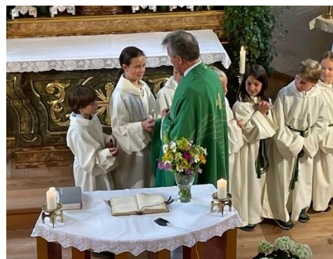
Text und Foto: M. Fersterer

In Hinterthal wurde unserem Herrn Pfarrer am 1. Juli zu seinem 25-jährigem Priesterjubiläum gratuliert. Nach dem Zusammensein bei einer kleinen aber feinen Agape fand dieser Abend einen gemütlichen Ausklang.